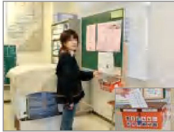
読み聞かせ部会/書き損じはがきボックス