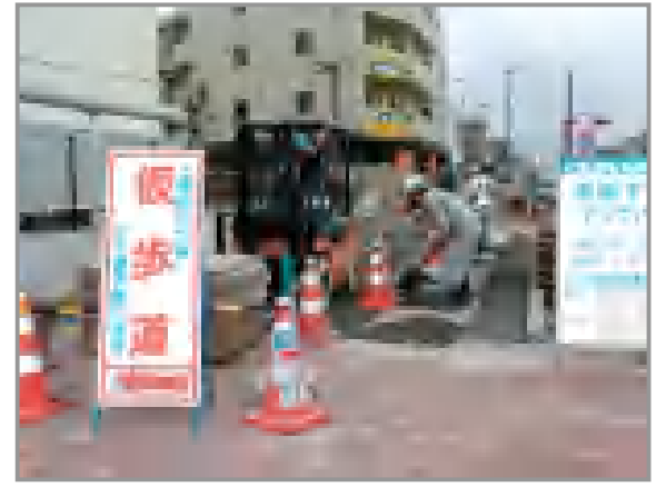
インターロッキングブロック舗装