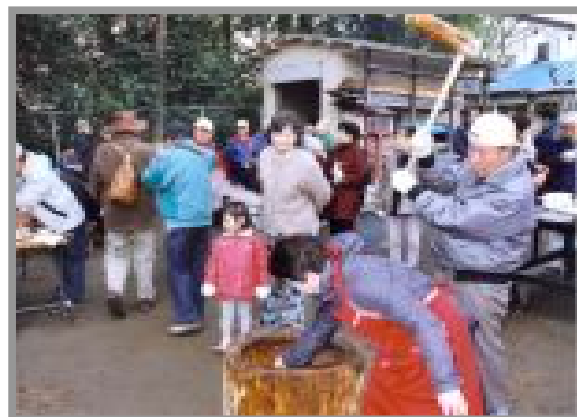
昨年の餅つき大会 / 熊野神社境内