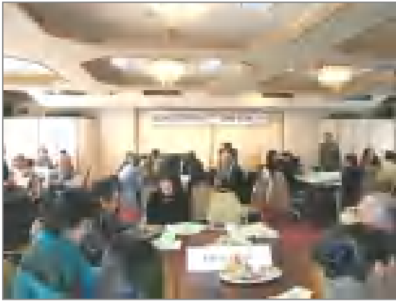
昭島市民国際交流会