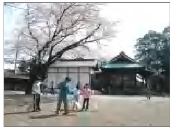
熊野神社清掃・親和子ども会