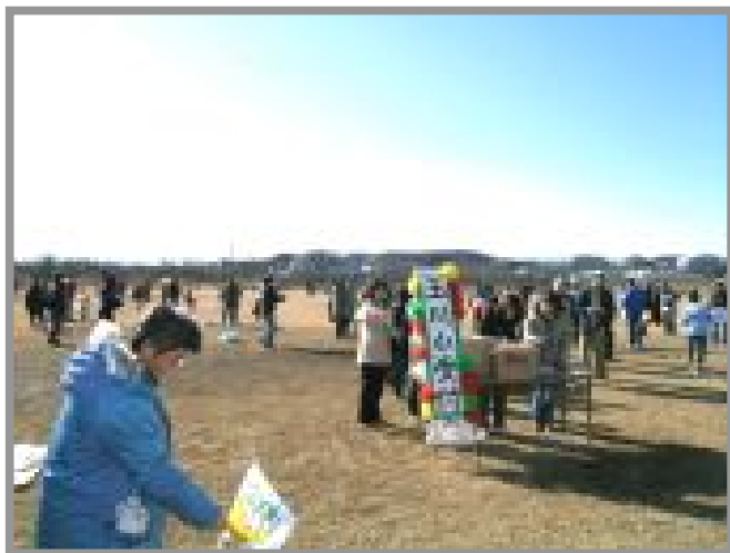
玉小(東部地区・くじら運動公園)