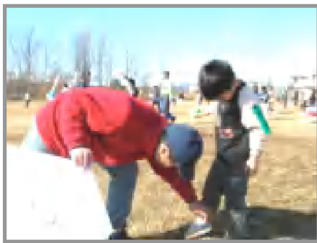
中小(中部地区・大神運動公園)